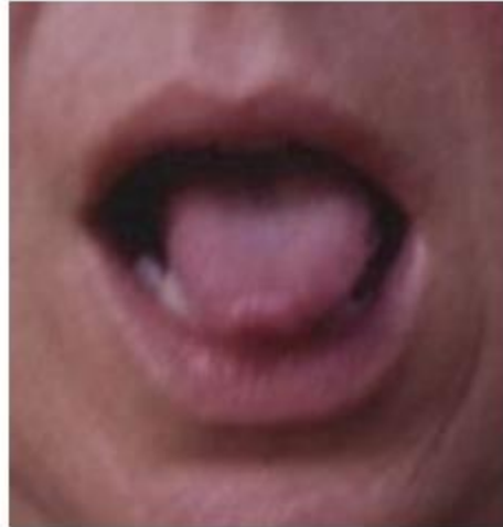
Lengua Corta y Roja

La lengua corta y roja se encuentra en pacientes que sufrieron un ataque de viento interno y estará desviada hacia un lado. Es también una señal importante que ayuda en la prevención de un ataque.