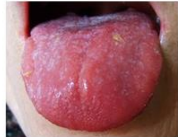
Lengua Roja con Puntos Rojos

http://www.tcm24.de/zungendiagnostik/ http://maciocioaonline.espanish.blogspot.mx/2010_08_01_archive.html