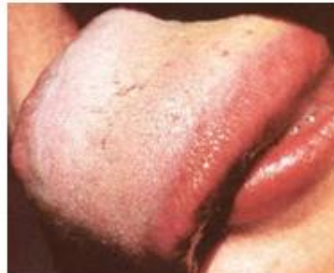
Lengua Roja con Saburra Gruesa Amarillenta