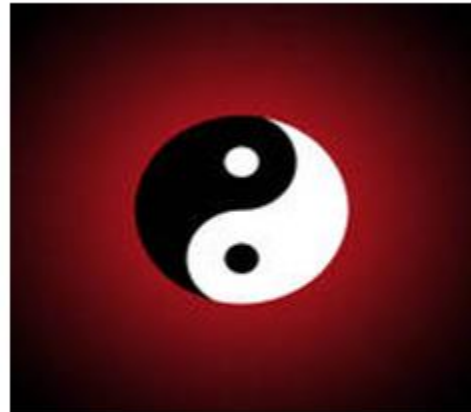
Símbolo Chino de Yin y Yang La Unidad que engendra a la Dualidad