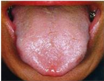
Lengua con Punta Roja