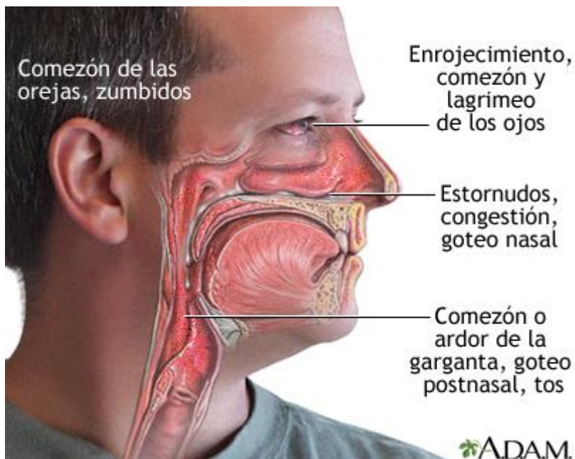
Fig. 2. Síntomas más comunes de la rinitis alérgica

Fuente: A.D.A.M. Copiado con fines educativos por Enrique Campos Rodríguez