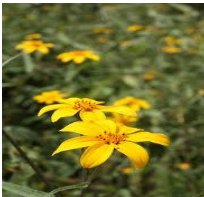
Acahual ( Tinthonia tubeaformis ), Estación de la Biósfera de Tepoztlán

Octubre del 2012