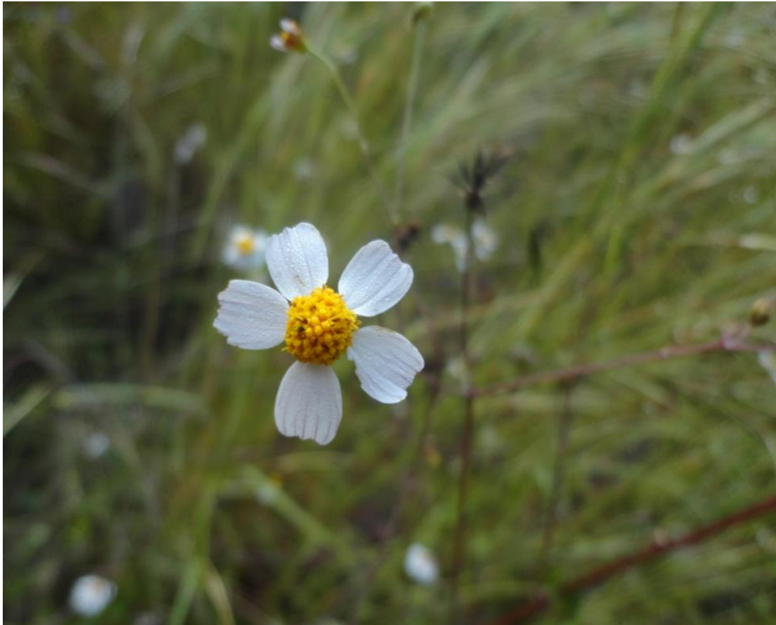
Aceitilla ( Bidens pilosa L.) Estación el limón. Reserva de la biosfera de la Sierra de Huautla Mor; México Noviembre 2012