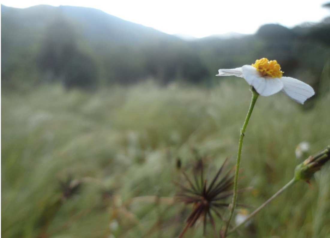
Aceitilla ( Bidens pilosa L.) Estación el limón. Reserva de la biosfera de la Sierra de Huautla Mor; México Noviembre 2012