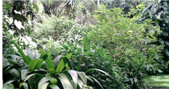
Plantas del Jardín Etnobotánico Lugar: Jardín Etnobotánico, INAH, Cuernavaca Morelos, Méx. Autor: Guadalupe J. Andrés.

Otro de sus herramientas indispensable eran las plantas que ahora sabemos que son medicinales, pero que anteriormente ellos no lo sabían y consideraban que eran mágicas. A través de su estudio y de observar cuales son sus propiedades ya podemos conocer y saber para que se utiliza cada una de esas plantas y cuales son sus propiedades curativas, además de que conocemos sus indicaciones y sus contraindicaciones (grado de toxicidad) de esta manera ellos que las utilizan en los tratamientos pueden recomendarlas de manera que no causen daño al que los consume y los toma.