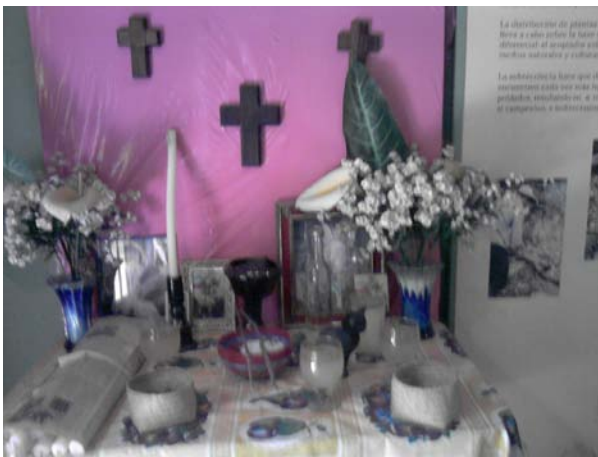
Altar de un curandero Lugar: Museo de Medicina Tradicional, INAH, Cuernavaca, Morelos, Méx.

Los curanderos han emplean diversas técnicas para curar las enfermedades una de ellas era: