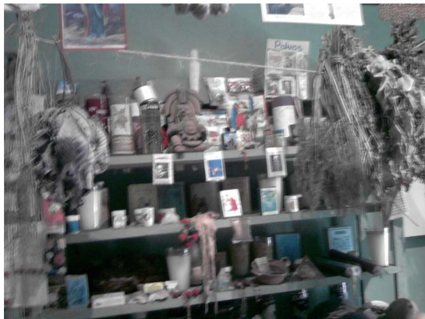
Plantas, preparados y utensilios de un puesto de herbolaria Lugar: Museo de Medicina Tradicional, INAH, Cuernavaca, Morelos, Méx.

Los exhortó a que si en algún momento necesitan algo acudan con un curandero, tengan la confianza de el los ayudar a poder recuperar la salud, pero eso si asegúrense de que sea una persona seria y responsable.