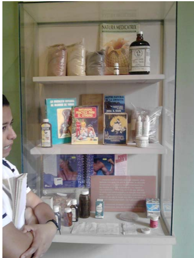
Gaveta con diferentes recursos y expresiones de la medicina tradicional, alternativa y popular. Lugar: Museo de Medicina Tradicional, INAH, Cuernavaca, Morelos, Méx.

Cabe destacar que en ambos casos la información se obtiene de manera empírica, es decir a través de la experimentación y de las experiencias de quienes anteriormente a realizado estas practicas y que les han funcionado, solo que como ya se dijo existen personas que realizan procedimientos basándose con las experiencias de otros, pero también cuentan con una fundamentación y la investigación; y algunos mas como los curanderos solo lo siguen transmitiendo de la misma manera que se los han transmitido a ellos.